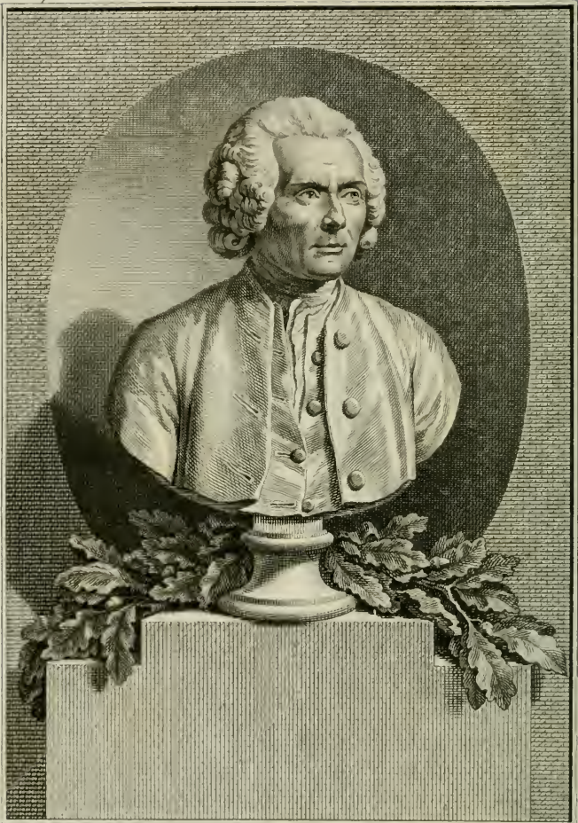
J. J. ROUSSEAU.